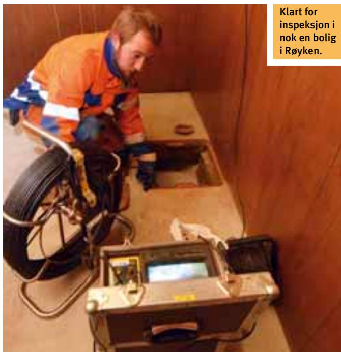
Klart for inspeksjon i nok en bolig i Røyken.