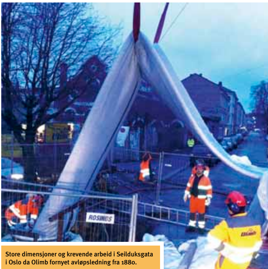
Store dimensjoner og krevende arbeid i Seilduksgata i Oslo da Olimb fornyet avløpsledning fra 1880.